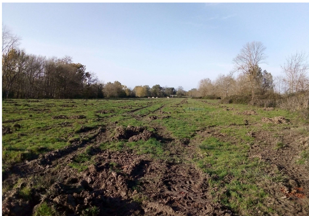
vue photographique 1