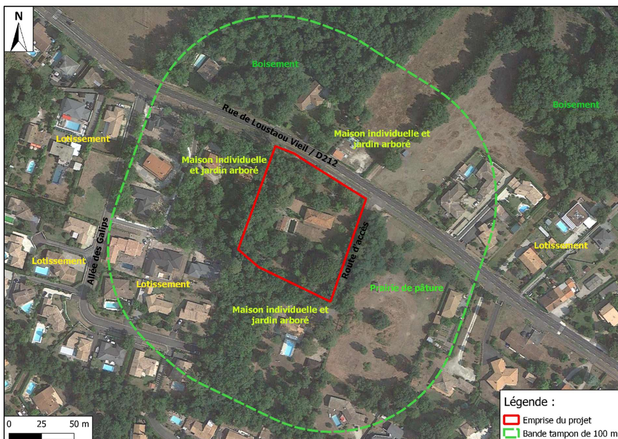
Figure 4 : Plan des abords (Source : Google Satellite ; Réalisation : CERAG)