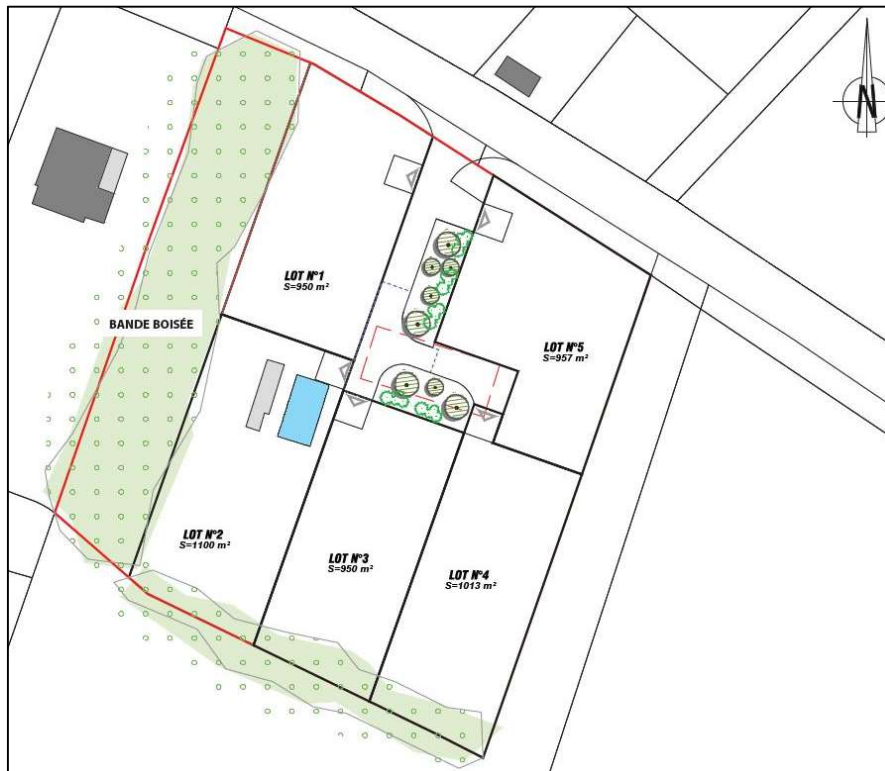
Figure 13 : Plan de composition

L'entrée de l'opération se fera depuis la route de Loustaou Vieil au Nord.