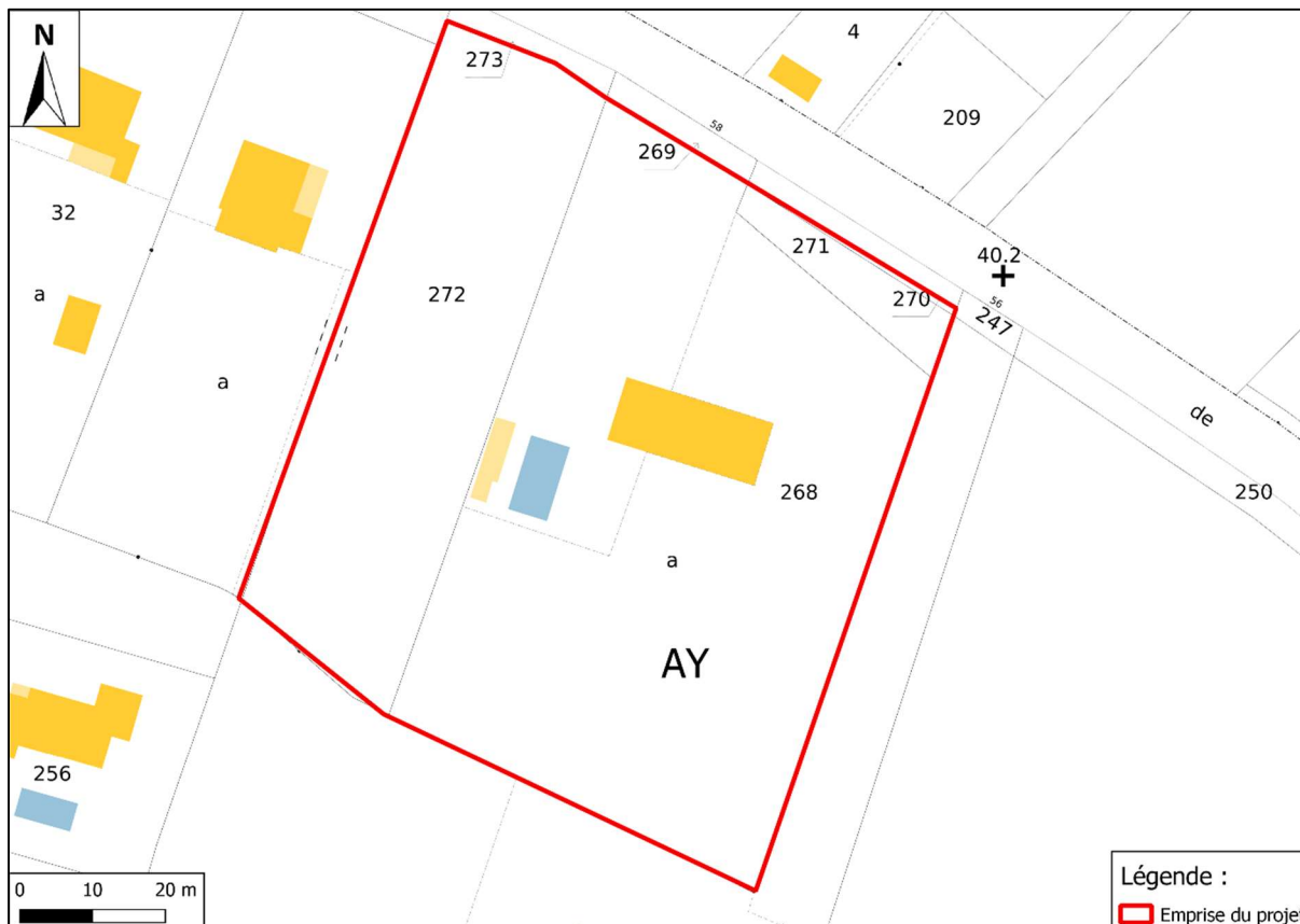
Figure 2 : Localisation cadastrale (Sources : cadastre.gouv.fr ; Réalisation : CERAG)

Les parcelles objet de la présente demande d'examen au cas par cas sont cadastrées section AY n°268, 271 et 272 du plan cadastral communal. La surface du projet est de 6 980 m 2 , pour un défrichement sur la totalité des parcelles.