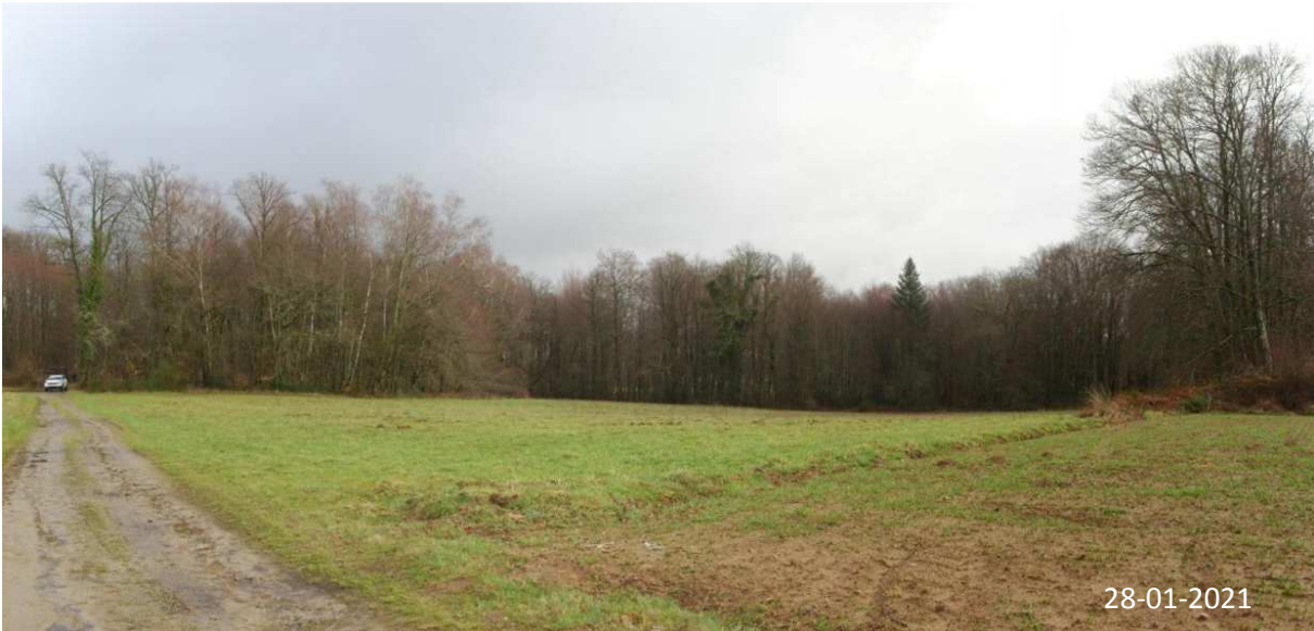
Prise de vue 1 (environnement proche)