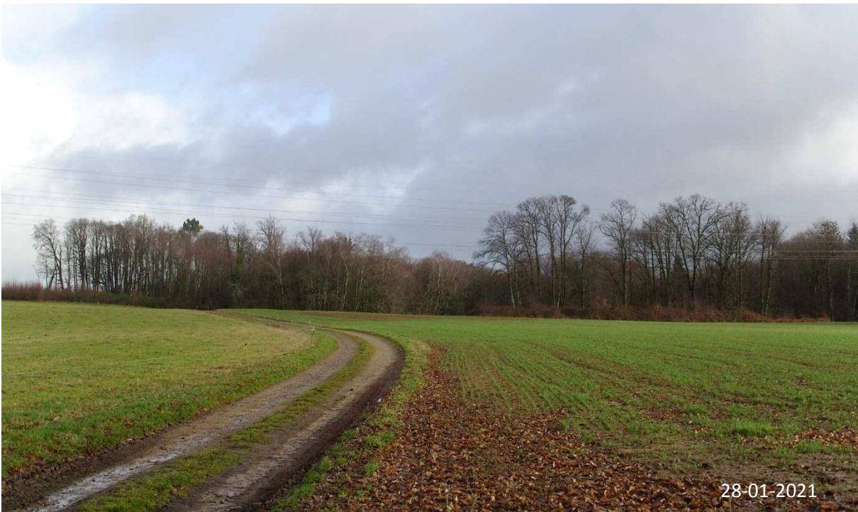
Prise de vue 2 (environnement lointain)