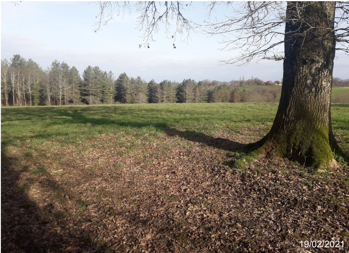
Prise de vue 2.