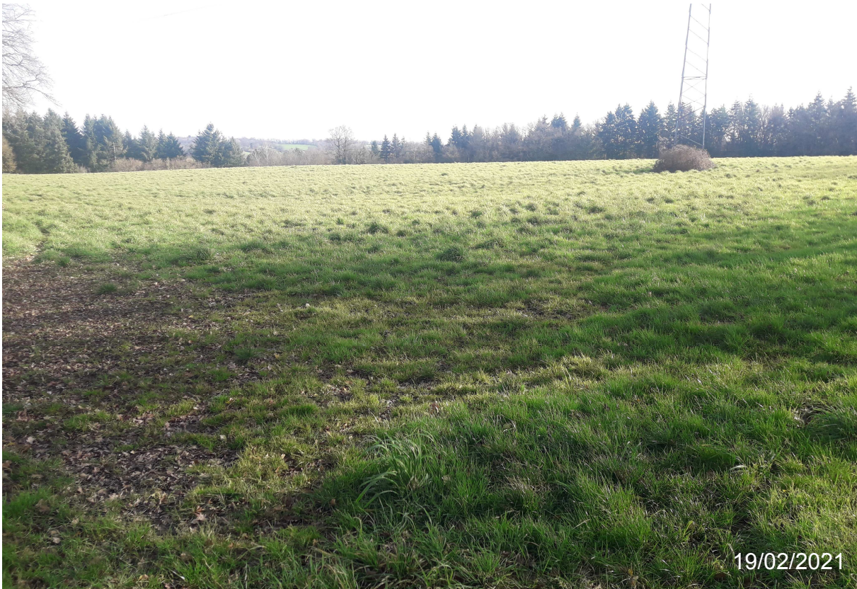
Prise de vue 1.