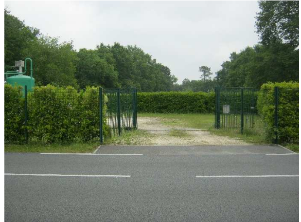
4 - Portail d'accès au forage et à la station de traitement