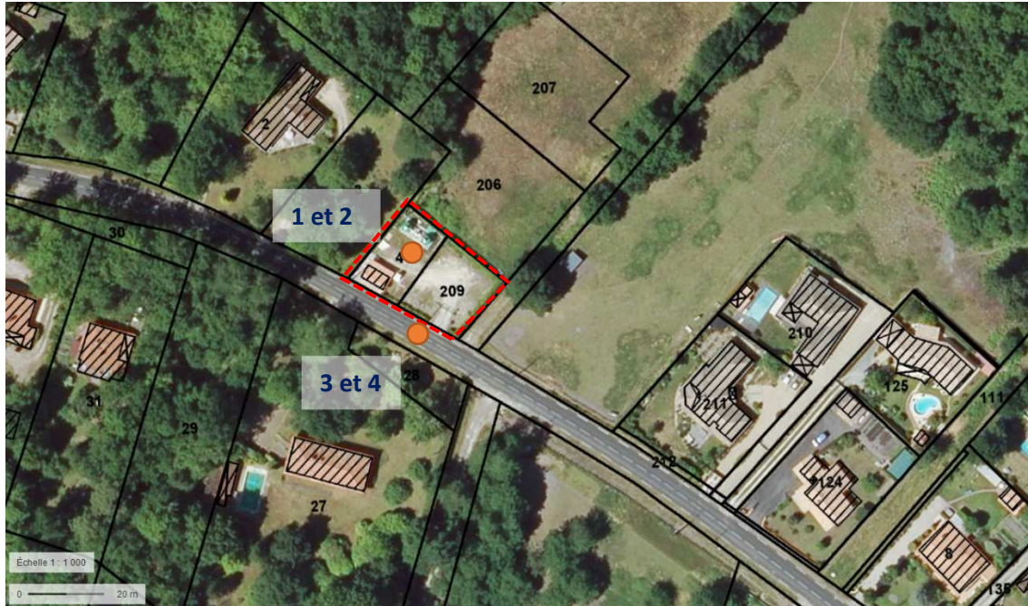
Vue aérienne et localisation des prises de vue – Captage Oustau Vieil