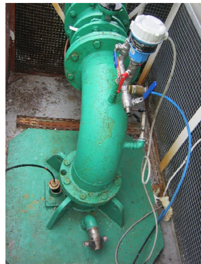
2 - Tête de puits et équipements