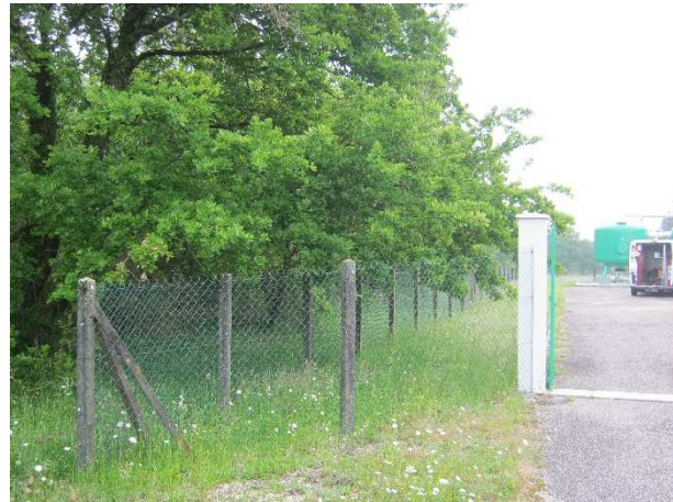
4 – Bordure nord du PPI