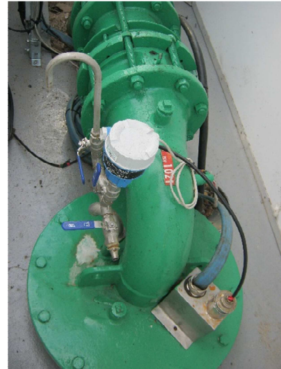
2 - Tête de puits et équipements