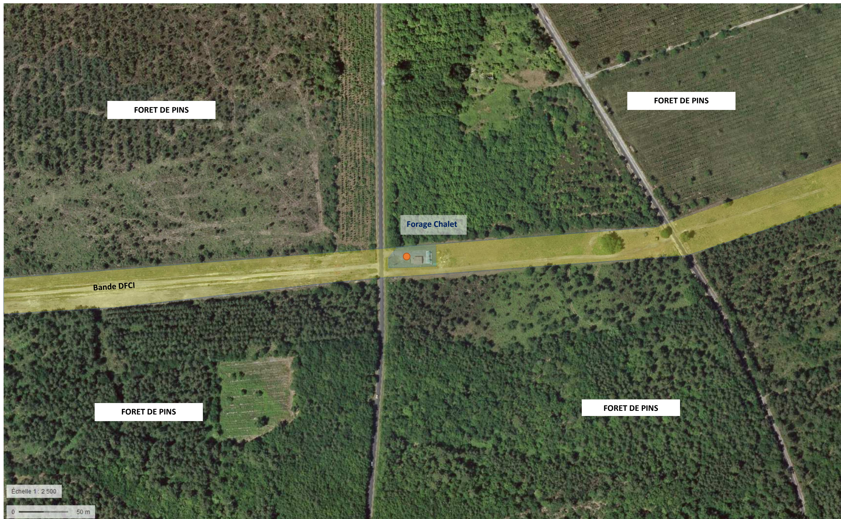
Plan des abords – Captage Chalet