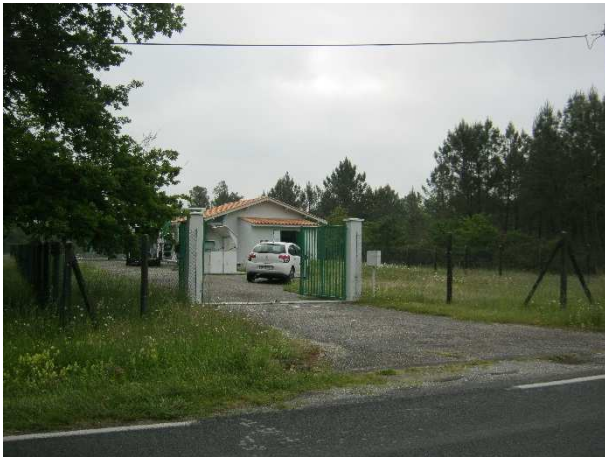
3 – Vue du portail d'entrée