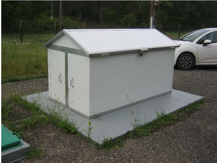
1 - Aménagement extérieur du captage