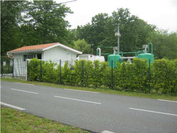
3 - Vue de la station de traitement