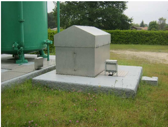
1 - Aménagement extérieur du captage