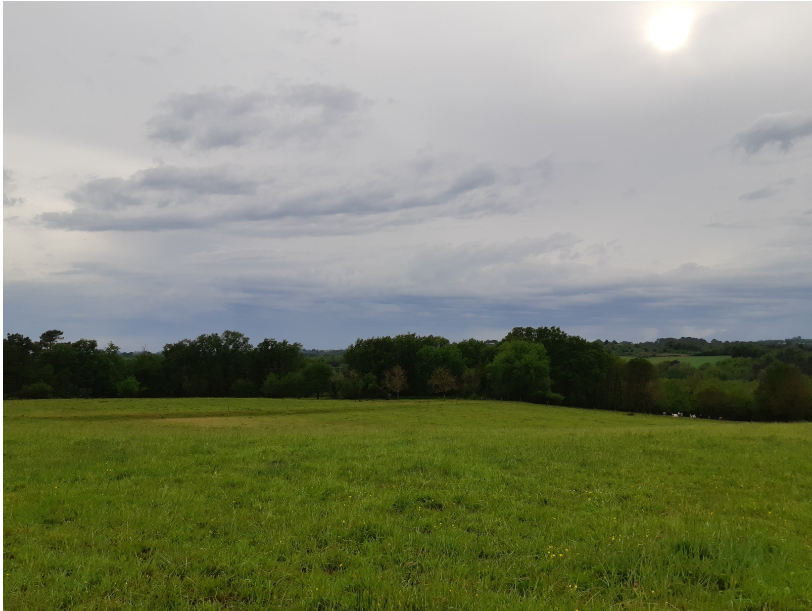
Annexe 3 : Photos de la zone à défricher, prisent le 09/05/2021