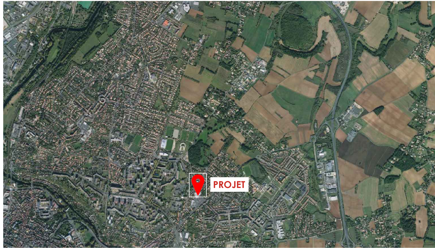
Photo aérienne - 1/25 000

Surface : 14 623 m 2 Sur les parcelles cadastrées BI 132 - 198 - 194 - 133 - 197 - 196 - 134 - 188 - 189 - 139 - 195 et 190