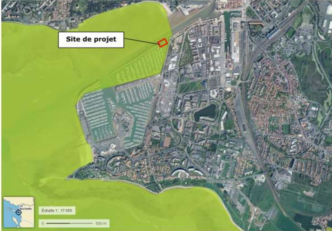
Figure : Extrait cartographie Zones Natura 2000 Directive Oiseaux