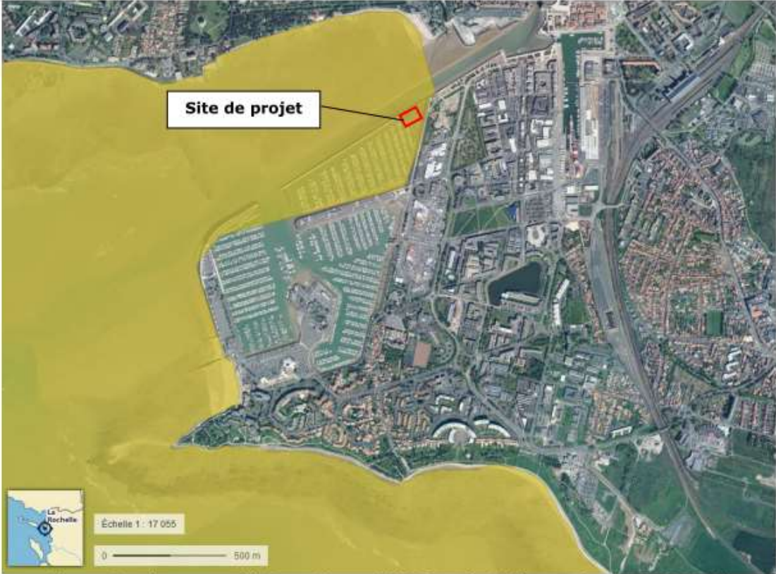
Figure : Extrait cartographie Zones Natura 2000 Directive Habitats