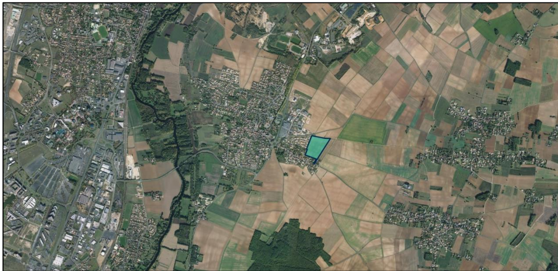
Localisation du projet d'aménagement sur fond IGN et vue aérienne (1/25000)