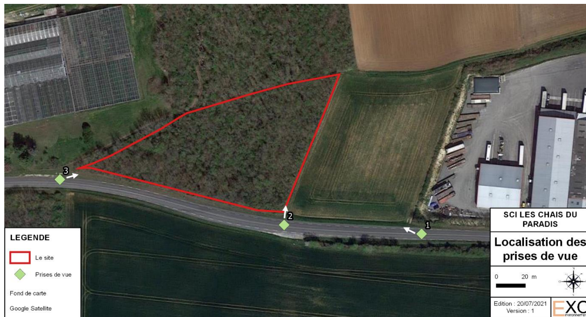
Figure 1 : Localisation des prises de vues entourant le site