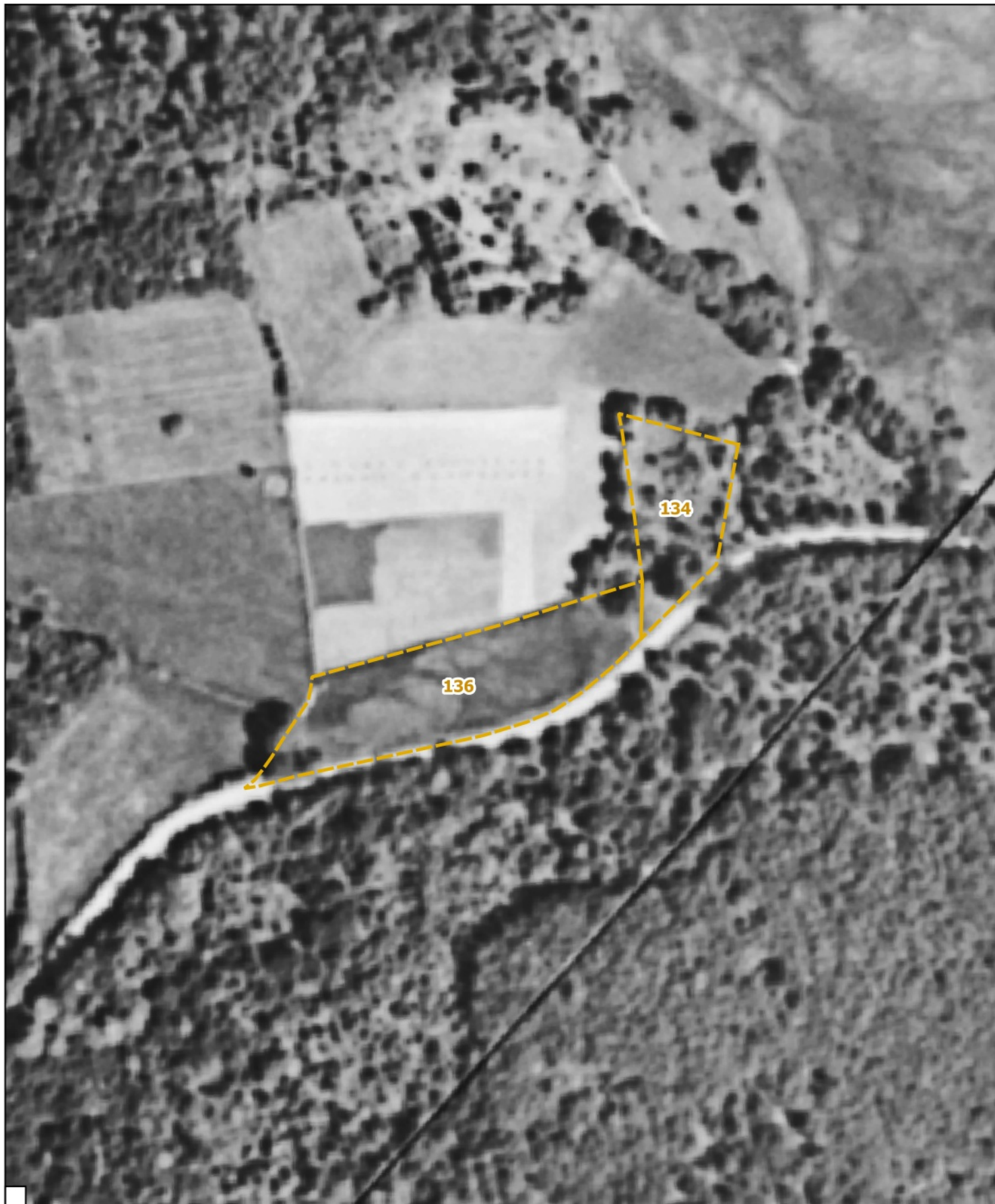
PHOTO HISTORIQUE 1950-1965