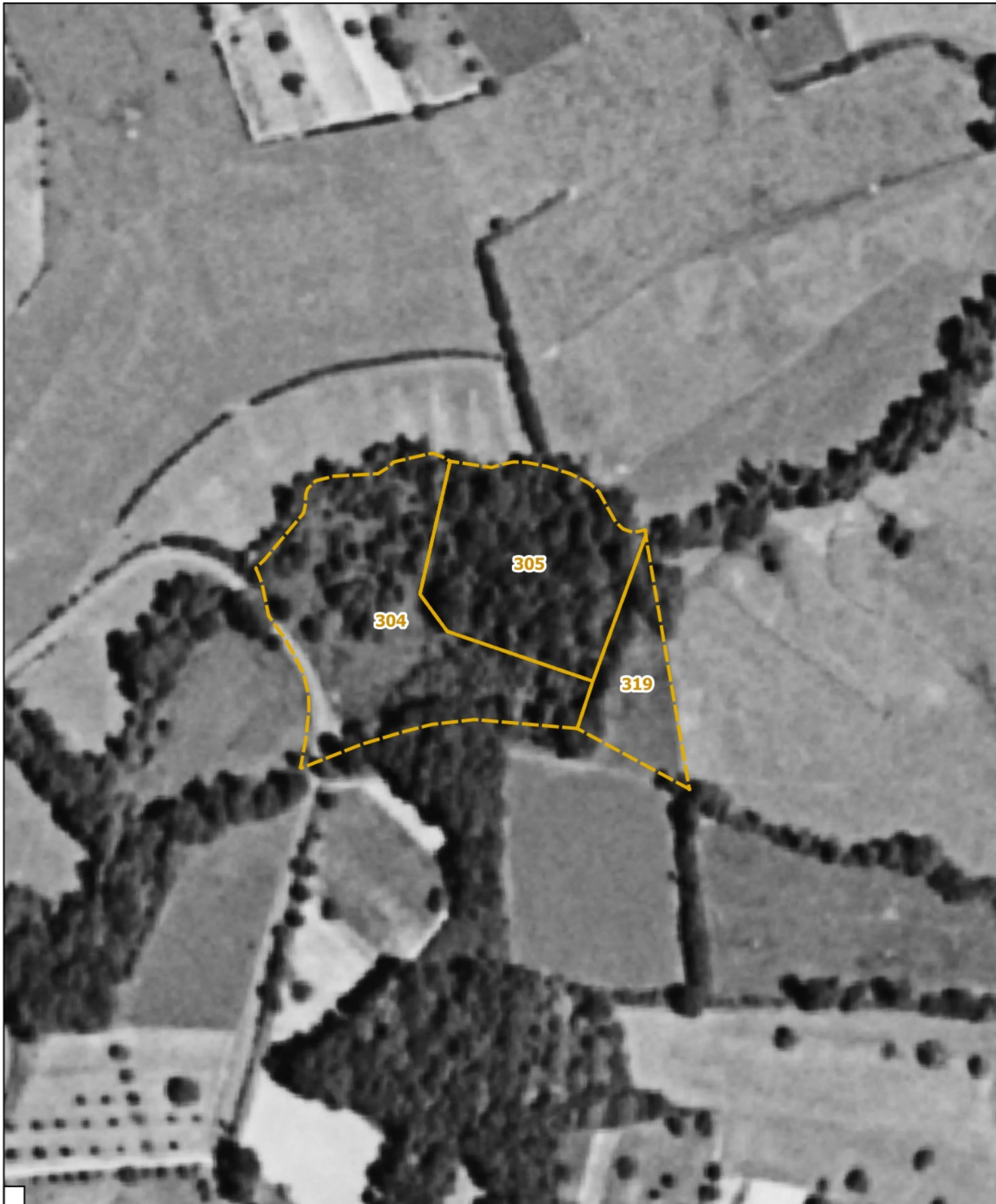
PHOTO HISTORIQUE 1950-1965