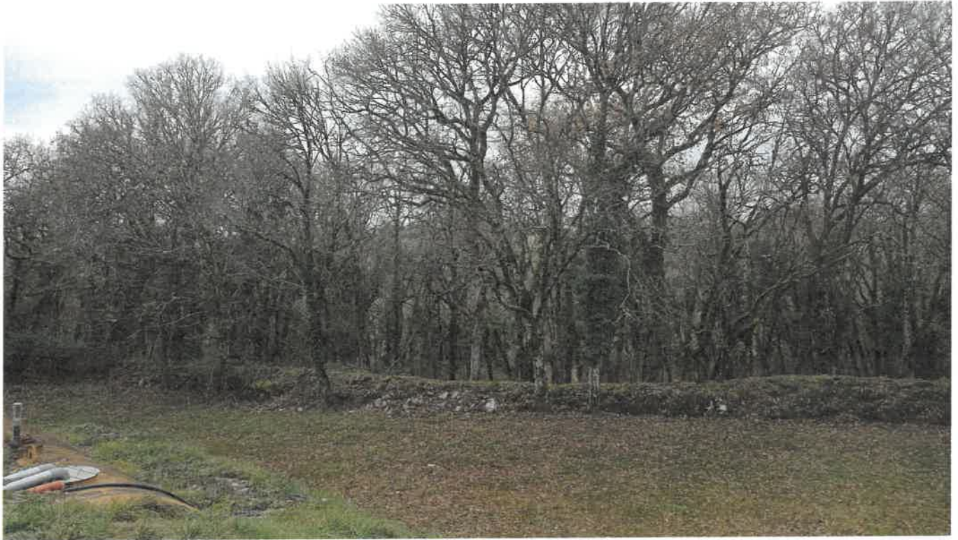
Parcelles A n° 21 et 22