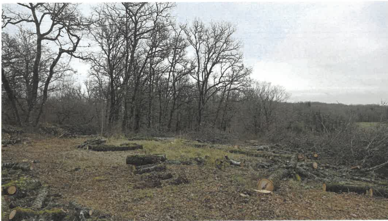
Parcelles A n° 213 et 214