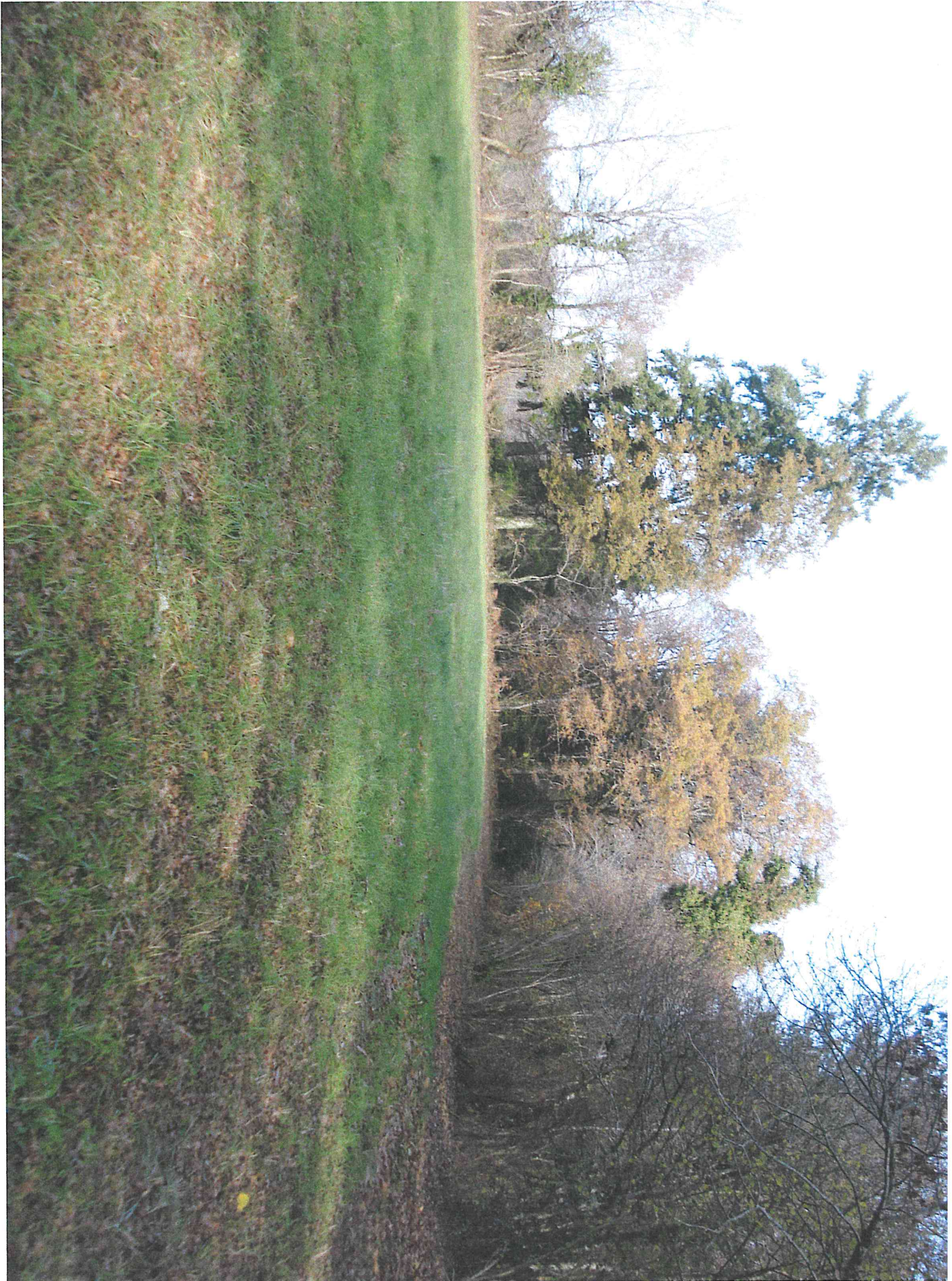
Parcelle 616 Photo A