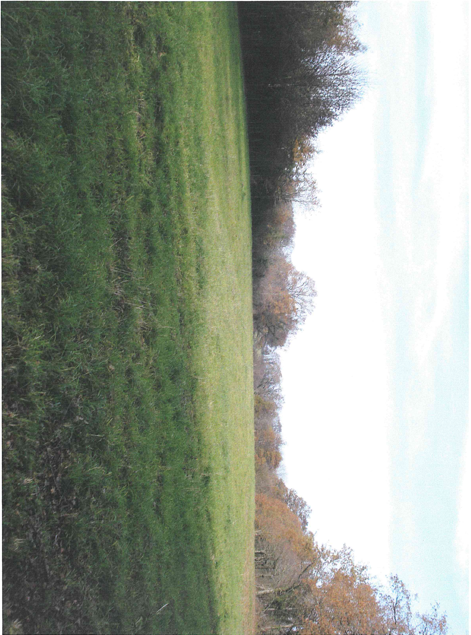
Parcelle 618 Photo B