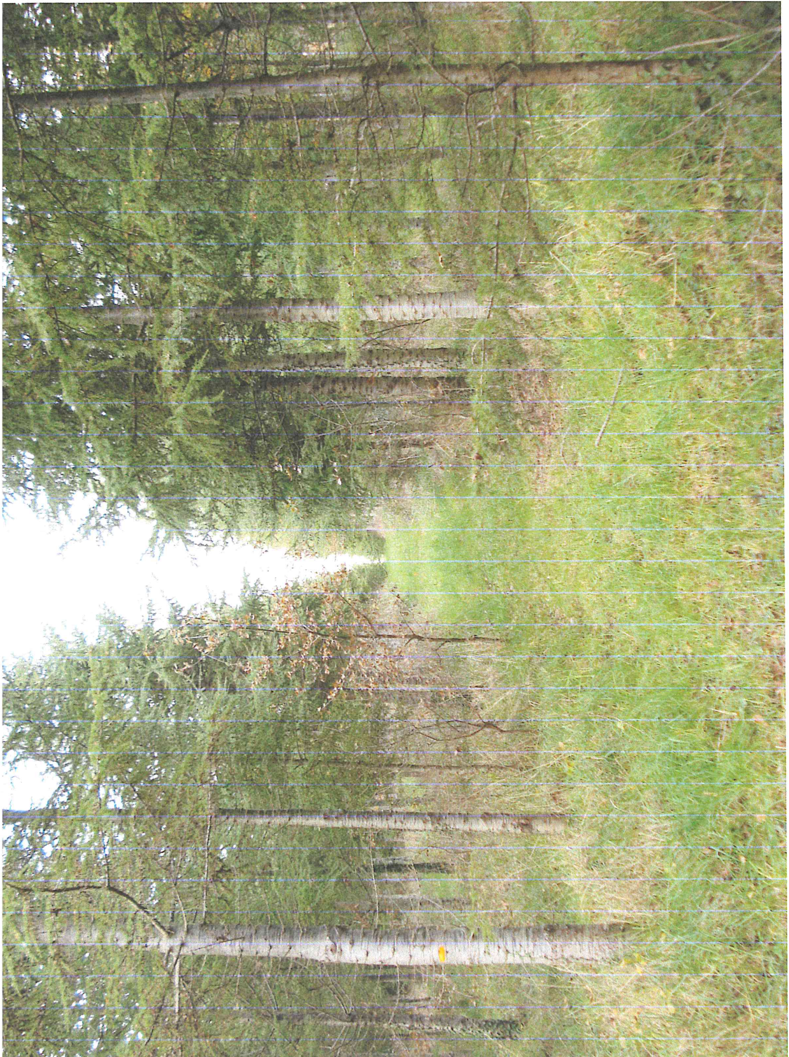
Parcelles section A 619 - 620 - 621 plantées en 2009 - Cèdre de l'Atlas