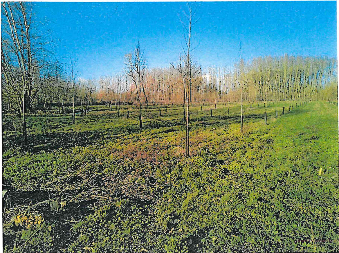
Parcelles ZB-126 et 127