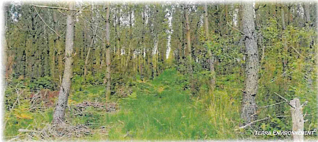
Figure 3 : Prise de vue 1, depuis le Nord-ouest du projet vers l'Est (projet)

Les photographies ont toutes été réalisées entre le 09 Juin 2021 et le 06 Aout 2021.