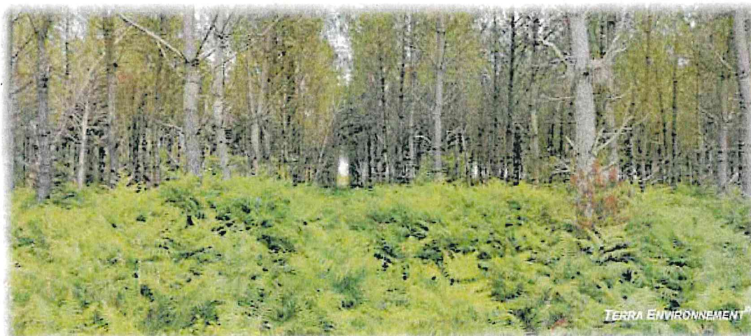
Figure 4 : Prise de vue 2, depuis le Sud-ouest du projet vers l'Est (projet)