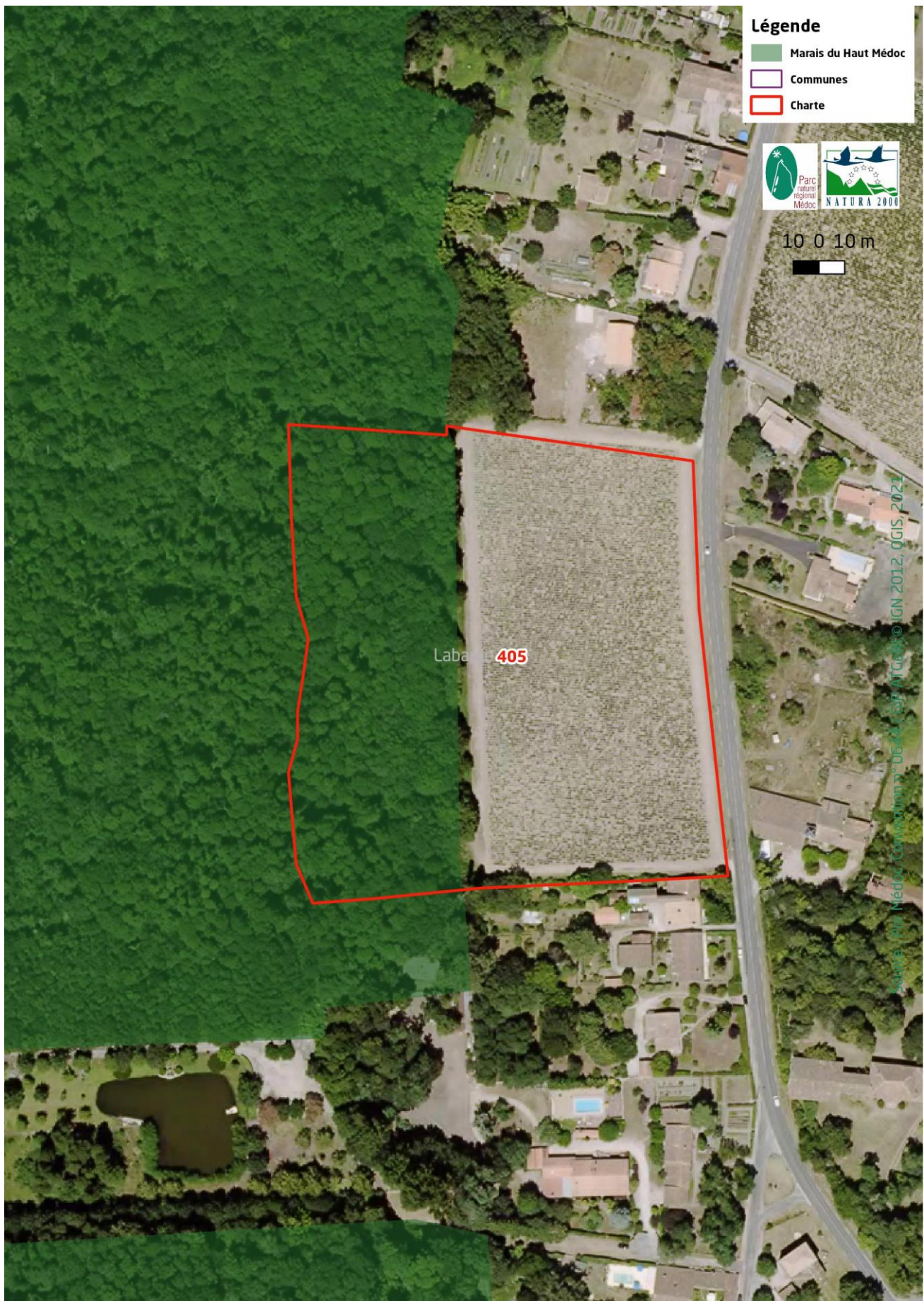
Figure 2 - Localisation du projet sur la commune