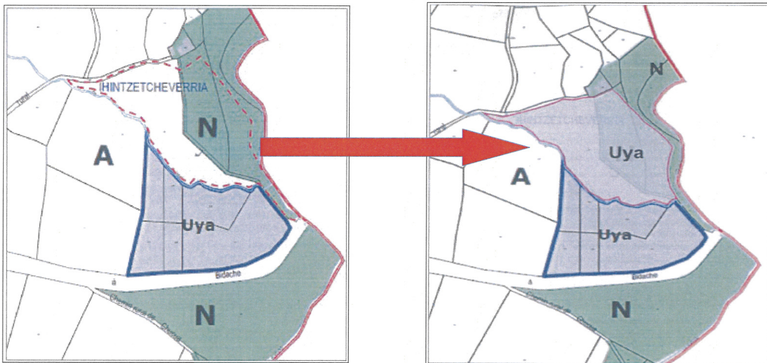
Zonage actuel et projeté

Conformément aux dispositions du code de l'urbanisme rappelées ci-dessous, le présent avis ne portera que sur les dispositions mises en compatibilité et non sur l'intégralité du PLU.