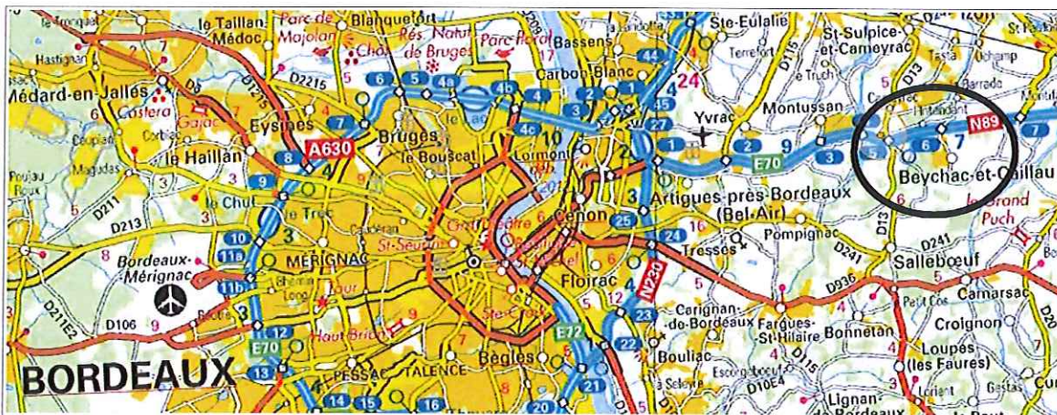
Situation de la commune (source GéoPortail – carte IGN)

Membre de la communauté de communes de Saint-Loubès, la commune est comprise dans le périmètre du SCoT de l'aire métropolitaine bordelaise, approuvé le 13 février 2014.