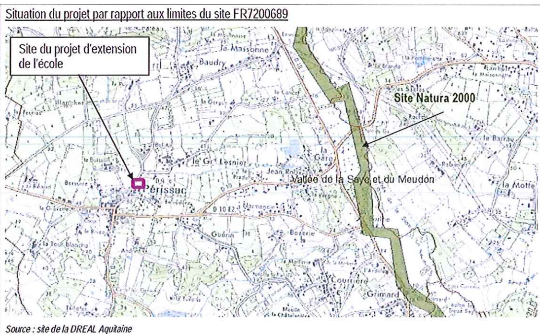
Extrait de la notice montrant la localisation du site du projet celle du site Natura 2000

Le site est situé à environ 1,5 km de la vallée de la Saye et ne dispose d'aucune connection hydrographique avec celui-ci.