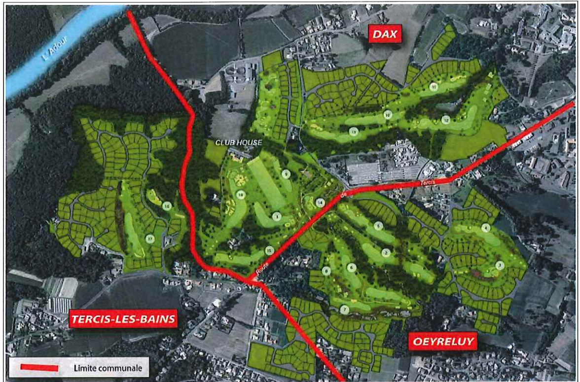
Plan général du projet d'aménagement sur les trois communes.

Les communes de Tercis-les-Bains, Dax et Oeyreluy comprennent pour partie le site d'implantation d'un vaste projet de golf intégrant également une part de logements. Ces trois communes disposent chacune d'un Plan Local d'Urbanisme (PLU) approuvé et comprenant les dispositions nécessaires à la réalisation du projet. Toutefois certains éléments du projet ont évolué depuis lors, engendrant la nécessité de procéder à des révisions simplifiées de ces trois documents. Les révisions envisagées aboutissent à l'augmentation de 2,96 ha des surfaces naturelles, y compris celles destinées au complexe golfique, au détriment des surfaces à urbaniser.