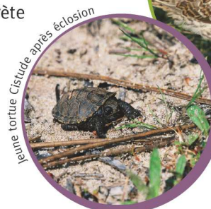
jeune tortue Cistude après éclosion