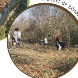
Chantier de bénévoles