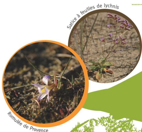
Satire à feuilles de lychnis

En complément, des actions de gestion sont mises en œuvre. La lutte contre le Baccharis (ou cotonnier : arbrisseau envahissant introduit du continent américain) est l'une des actions menées pour permettre le retour de la flore autochtone.