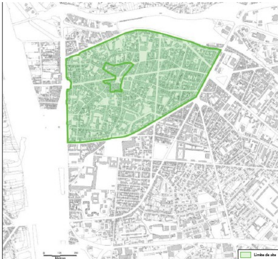
Cœur de ville - Quartier des Cornières (Agen)