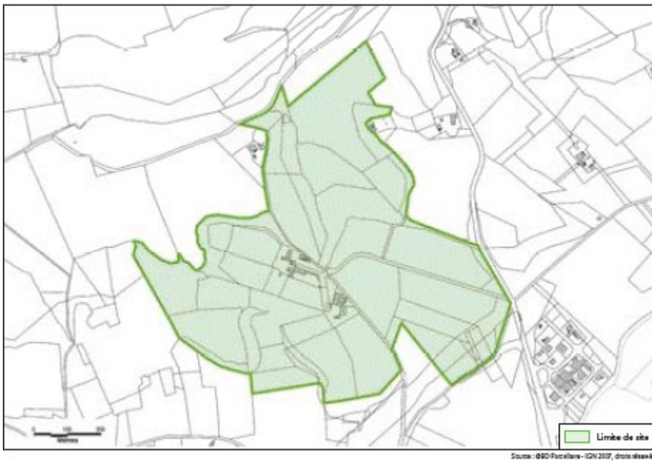
Site de Talives