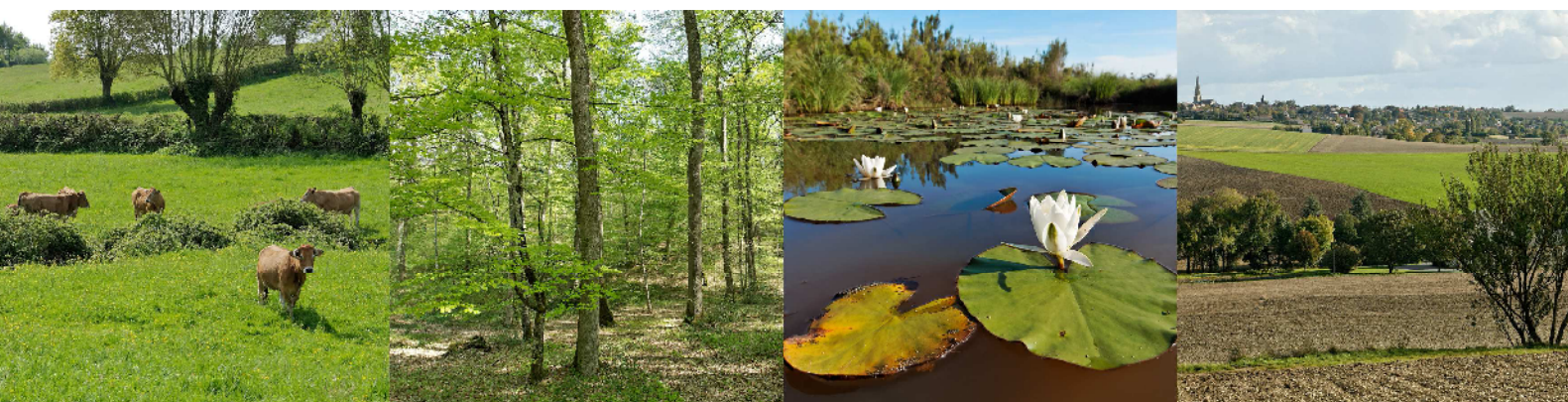
Schéma régional de cohérence écologique