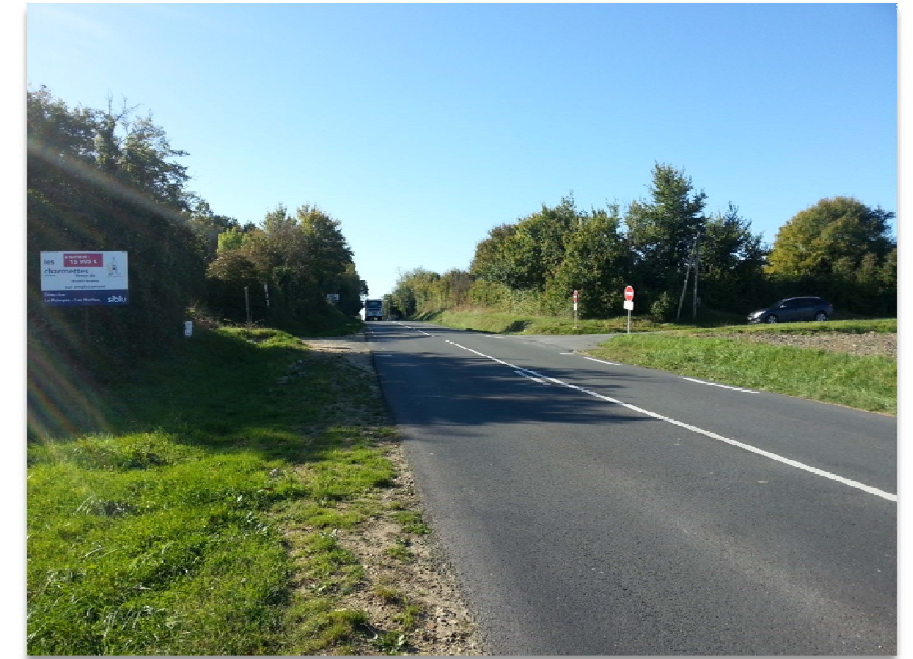
Photographie n° 3