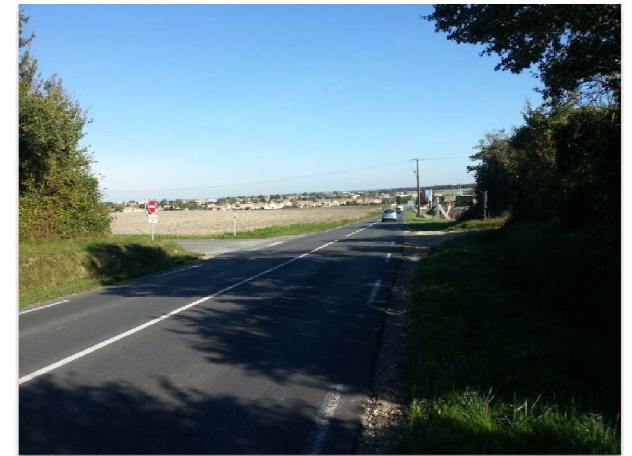
Photographie n° 4