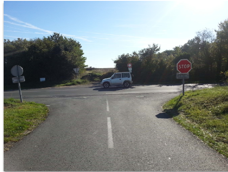
Photographie n° 1