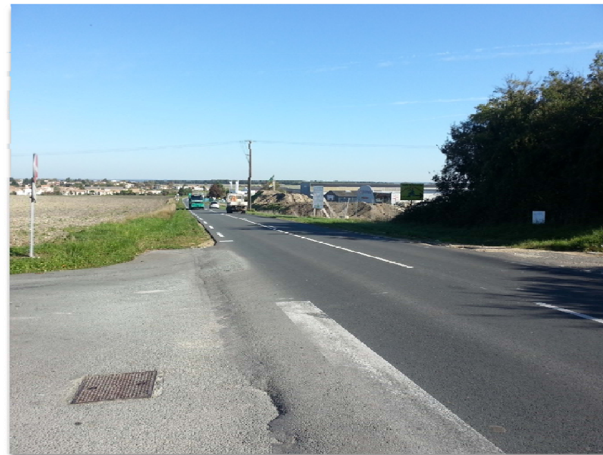
Photographie n° 2